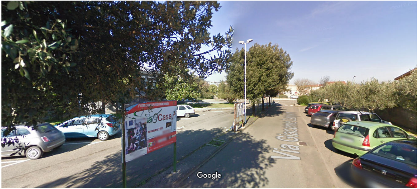
Data dell'immagine: feb 2011

14 Via Giacomo Leopardi modello parcheggio