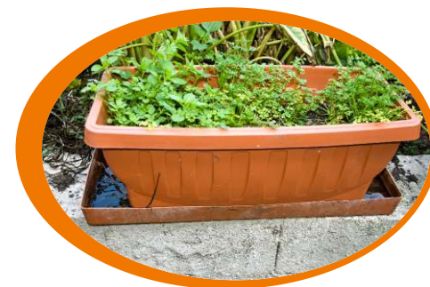
Elimina i sottovasi e, se non puoi toglierli, evita il ristagno d'acqua