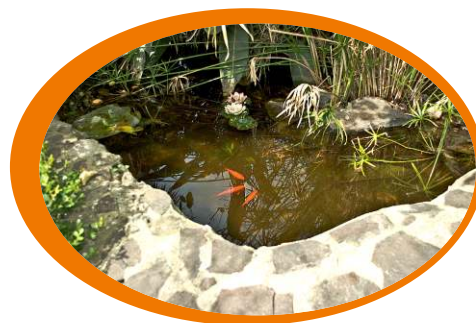
Tieni pulite fontane e vasche ornamentali, eventualmente introducendo pesci rossi (predatori di larve di zanzare)