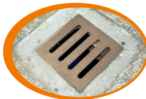
Pulisci accuratamente i tombini e le zone di scolo

Proteggiamoci dalle punture: usiamo zanzariere alle finestre, repellenti e abbigliamento adeguato quando siamo all'aperto soprattutto all'alba e al tramonto.