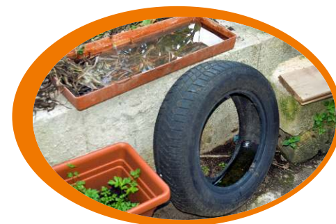
Evita di abbandonare i pneumatici e di far ristagnare l'acqua