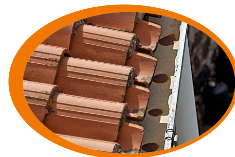
Controlla periodicamente le grondaie mantenendole libere e pulite