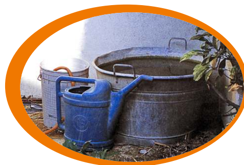
Non lasciare gli annaffiatori e i secchi con l'apertura rivolta verso l'alto